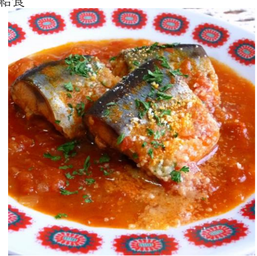
●●●さんまのトマト煮●●●