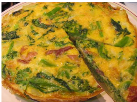
●●● 菜の花のスパニッシュオムレツ ●●●