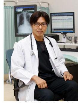
皆さまこんにちは。

「純心会理念」 信頼される医療 想いと優しさの伝わるケア 私たちはそれを目指します