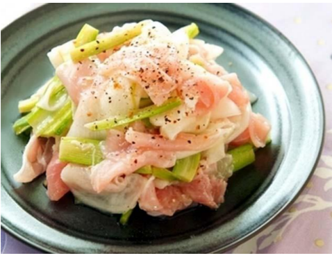
●●● 生ハムとカブのマリネ ●●●