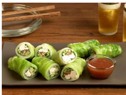
きゅうりのキャベツ巻き 梅肉ソース